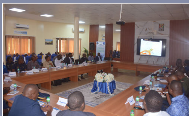
DAKSAR 2025 : L'ARMÉE DE L'AIR A TESTÉ LE DISPOSITIF NATIONAL DE RECHERCHE ET DE SAUVETAGE