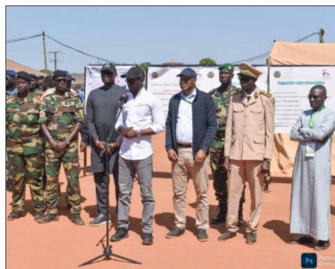
DÉPLOIEMENT D'UN HÔPITAL MILITAIRE DE CAMPAGNE À GOUDOMP