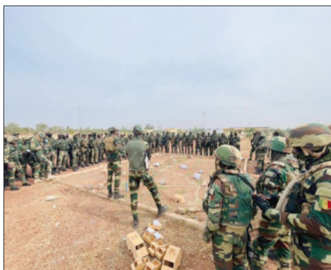
OPÉRATION « BOUNDOU 2025 » : PLUSIEURS SITES D'ORPAILLAGE CLANDESTIN DÉMANTELÉS