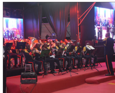
GALA DES ARMÉES : LES FORCES ARMÉES RENOUENT AVEC UNE VIEILLE TRADITION